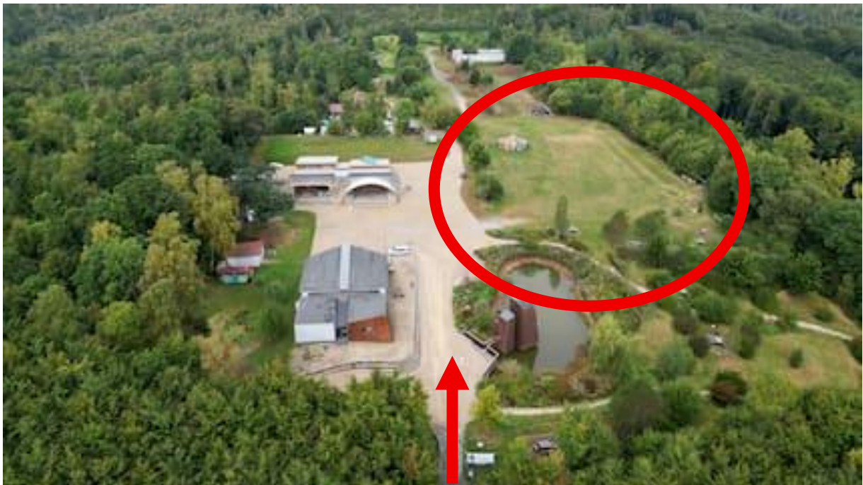
Unsere gebuchte Wiese mit Toilettenanlagen