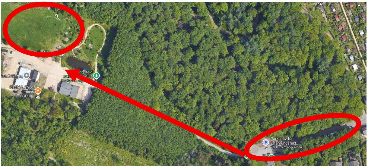
Übersicht Parkplatz zur Wiese